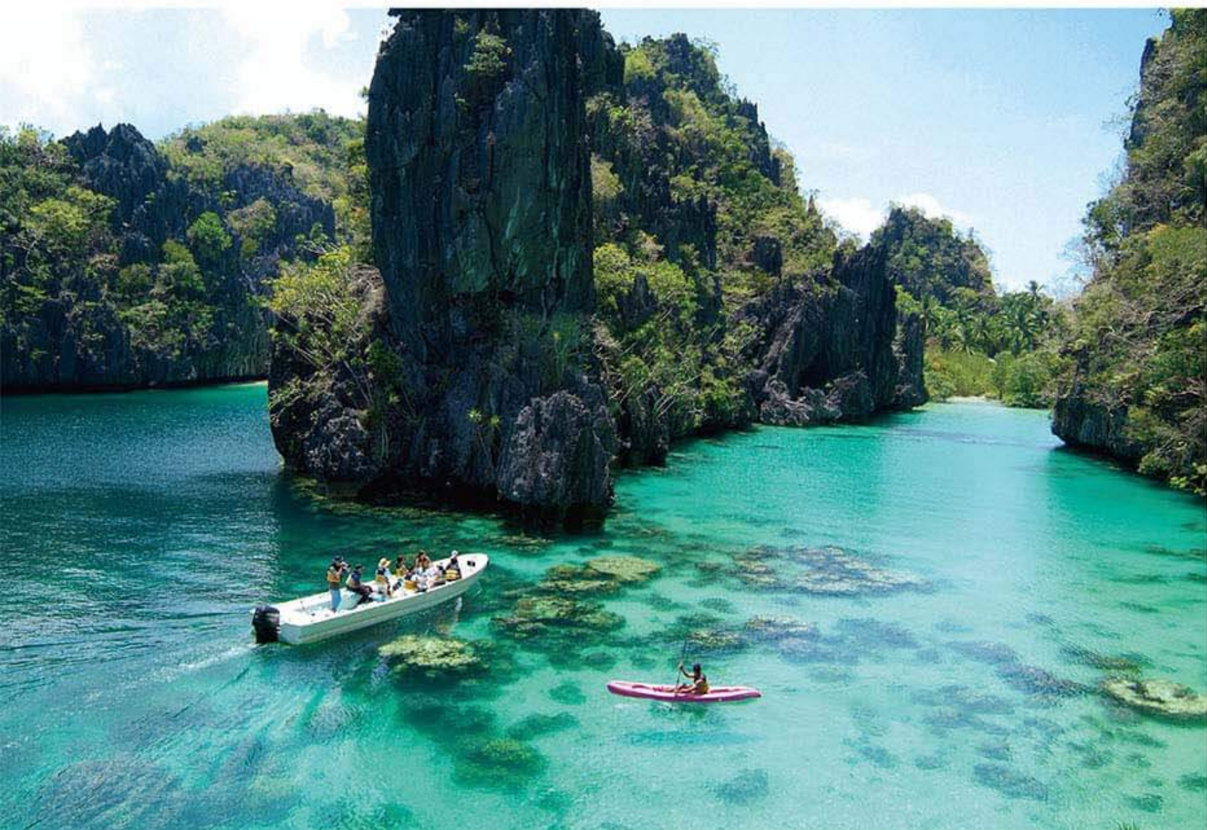
2 | PHILIPPINES